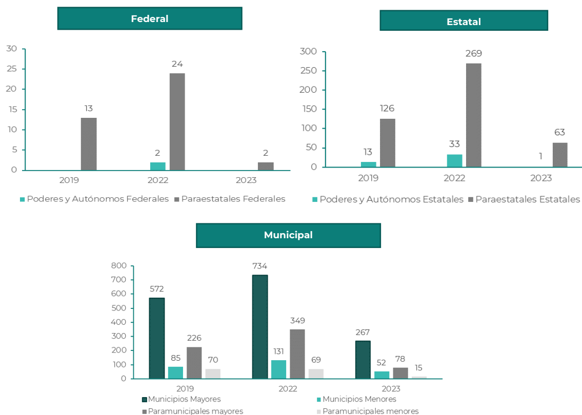
Gráfica 1 - 3. Entes públicos que no refirieron información del sistema de contabilidad gubernamental por nivel de gobierno.

Conforme a la evaluación aplicada en los ejercicios 2019, 2022 y 2023, se aprecia una mayor participación por orden de gobierno, es decir, se presentó una reducción en el número de entes públicos que no proporcionaron información conforme a lo siguiente: